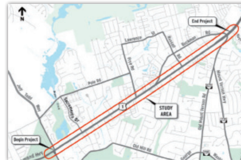
Área del Proyecto de mejoras del Corredor de Richmond Highway

Propósito: Aumentar la capacidad, seguridad y movilidad